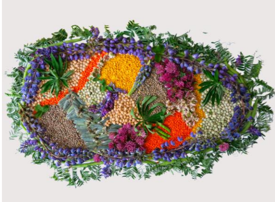
Collage eines Knöllchenbakteriums aus Pflanzen, die mit Knöllchenbakterien (Rhizobien) zusammenleben: außen Wicken- und Bohnenblätter sowie Lupinenblüten, innen Linsen, Kichererbsen, Erbsen und Klee.