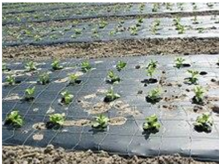
Mulchfolie aus Poly-Milchsäure ist biologisch abbaubar.

Biotechnologisch werden Laktobazillen eingesetzt, um im industriellen Maßstab Milchsäure herzustellen – weltweit etwa 500.000 Tonnen pro Jahr. Als Lebensmittelzusatzstoff (E 270) erhöht Milchsäure die Haltbarkeit von Back- und Süßwaren sowie Limonaden. Auch Seifen, Cremes und Spülmittel enthalten die desinfizierend wirkende Milchsäure.