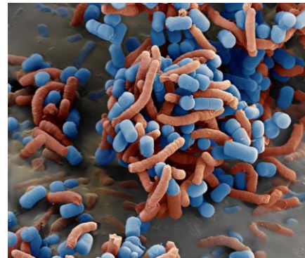
Lactobacillus reuteri (blau) verklumpt und inaktiviert den Magenkeim Helicobacter pylori (rot) – hier 11.000fach vergrößert.

Laktobazillen übernehmen viele weitere Aufgaben für unsere Gesundheit: Dank bestimmter Enzyme machen sie für den Menschen unverdauliche Kohlenhydrate zugänglich – vor allem die Ballaststoffe aus Vollkorn und Gemüse, die im Dünndarm die erwünschten Darmbakterien stimulieren. Solche Ballaststoffe werden heutzutage als „Präbiotika“ manchen Lebensmitteln zugesetzt, beispielsweise in Form der langkettigen Zucker Inulin oder Oligofruktose. Als „Probiotika“ werden hingegen Nahrungs- oder Heilmittel bezeichnet, die gezielt bestimmte Bakterienstämme enthalten. Ob natürlich oder zugesetzt: Laktobazillen sind wichtig für die Funktion der Darmschleimhaut, die Nährstoffe vom Darm ins Blut transportiert und auch unser Immunsystem unterstützt. Ist es gestört, können Infekte und Autoimmunkrankheiten entstehen. Studien legen nahe, dass Laktobazillen sogar unser Wohlbefinden beeinflussen: Bestimmte Lactobacillus -Stämme verringern in Mäusen ängstliches und depressives Verhalten - möglicherweise weil sie Botenstoffe produzieren, die bei der Nervenübertragung im Gehirn eine Rolle spielen.