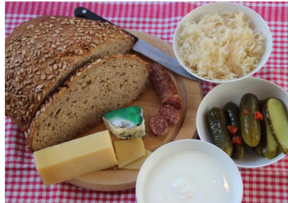
Lactobacillus verdanken wir vielfältige haltbare Lebensmittel. In der Lebensmittelindustrie werden heute gezielt bestimmte Lactobacillus -Stämme zur Fermentation eingesetzt.

Die Mikrobe des Jahres haben Sie heute vermutlich schon mehrfach verzehrt: als Sauerteigbrot mit Käse oder Salami, im Joghurt oder in Form von Sauerkraut, roter Bete, eingelegten Gurken oder Oliven. Die Laktobazillen - übersetzt „Milch-Stäbchen“ - sind Teil unserer Kulturgeschichte: Vor etwa 7000 Jahren begannen sesshaft gewordene Viehzüchter in Nordeuropa verstärkt Milch(producte) zu verzehren. Die Bildung des eigentlich nur bei Säuglingen vorhandene Enzym Lactase für den Abbau von Milchzucker setzte sich daraufhin bei erwachsenen Mitteleuropäern durch - während etwa die